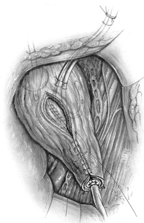
Abb. 6 Zweischichtiger Verschuß der Blase